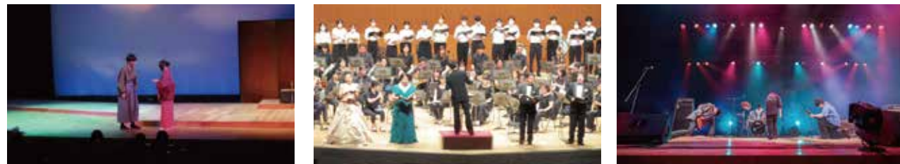
(これまでの採択作品より)

多彩で個性あふれる新たな「千葉文化」の創造を目指し、文化会館を活動の場として提供し、県民の自主的な文化活動に対して助成します。文化会館のステージからあなたの想いを伝えてみませんか?応募は例年6月から10月末まで募集しています。