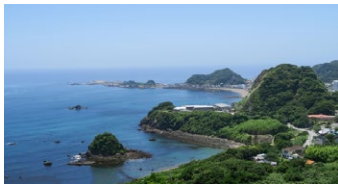
▲魚見塚展望台から望む新日本百景の鴨川松島と波太富士

太海は波の豊かな恵みへの感謝から「波太（なぶと）」とも呼ばれ、近代洋画の先駆者である浅井忠が房総旅行の際に波太海岸の自然美を発見しスケッチしたのが、写生地としての波太海岸の始まりとされています。その後、多くの画家が写生のために訪れるようになり、「西の波切（三重県の波切海岸）、東の波太」と称される日本二大写生地になったのです。“日本のセザンヌ”と呼ばれた安井曾太郎が描いた『外房風景』を筆頭に、多くの画家たちが訪れた足跡として作品を残しています。