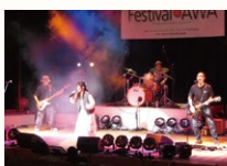
「ライトミュージックフェスティバル イン アワ」(令和6年公演より)

千葉県ではさまざまな場所で音楽フェスが開催されていて、音楽ファンからは「フェス大国」と呼ばれています。こうした盛り上がりの後押しするため、将来性のある若手アーティストを発掘・支援する「アーティスト・フォローアップ(モデル)事業」で軽音楽分野を設けるなど、ロックや軽音楽を応援しています。