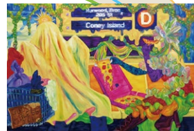
▲ニューヨーク滞在中にパンデミックによる外出禁止令を経験し創作した「世界の終わりでピザを食べる」。 ◀「Eat Pizza at the End of the World」2022年 油彩、キャンバス 1940×1303mm

◀「The H"a'ngry Rabbit Eats the World」2023年 塩化ビニール、アクリル 他 6×6×6m