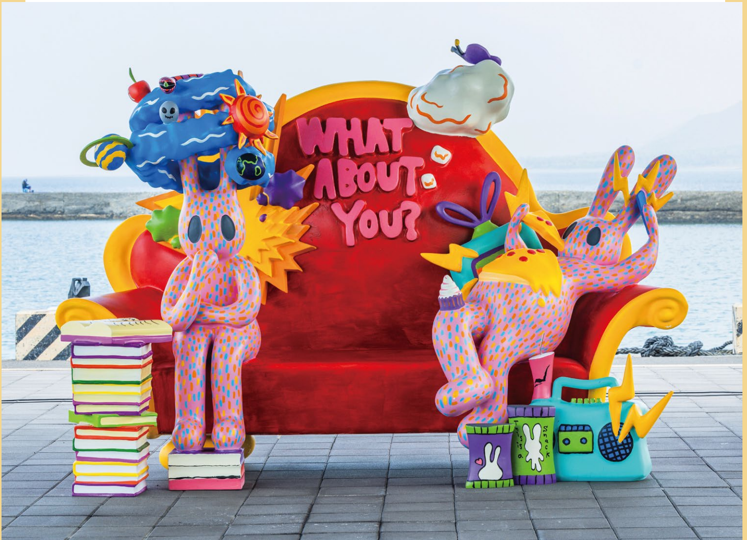
ABEYUKA. 《Be the Butterfly》2023年 FRP, アクリル絵の具, 他 3×2×1m