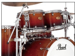
◀「Reference One Series」。プロドラマーの要求を満たすよう設計されたハイエンドモデル。

その後もパールは、音楽ジャンルのブームや演奏の楽しみ方の変化に応じて、新たなドラムのモデルを次々と発表。あらゆるジャンルに適した多彩なラインナップを揃えています。