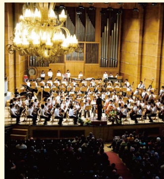
「日本・ブルガリア国交回復50周年記念演奏会」 (平成21年, ソフィア市ブルガリアホールにて)

日ごろの練習の成果を披露する場として、毎年3月に定期演奏会を開催するほか、特別演奏会や招待演奏会も行っています。場所は県内・県外を問わず、海外へ招かれることも! これまでに米国、韓国、ドイツ、ブルガリアで演奏会を行い、いずれも好評を博しました。また、平成31年には、眞子内親王殿下並びに佳子内親王殿下の御臨席を賜り、サントリーホールにおいて単独公演を行いました。