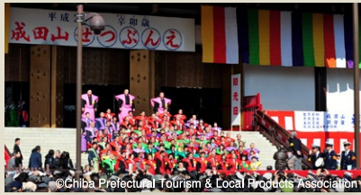
▲成田山節分会では、大豆が860kg、からつき落花生400kg、剣守365体が盛大にまかれます。

成田山新勝寺では毎年立春の前日（主に2月3日）、災厄をはらい一年の幸福を祈る伝統行事として「節分会」を開催。国土安穏・万民豊楽・五穀豊穰・転禍為福の祈りを込め、色鮮やかな袴に身を包んだ年男たちが「福は内」の掛け声に合わせて、大本堂前で盛大に豆をまきます。