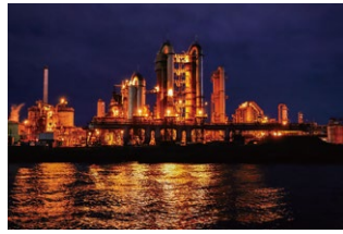
▲コークス炉 (JFEスチール東日本製鉄所)

近年はこうした「工場夜景」が全国で人気を集めていて、千葉港の工場夜景も「日本13大工場夜景」の一つに数えられています。千葉ポートタワーの地上113mの展望台からは眼下に広がる海の光を眺めることができます。また、千葉港を周遊するクルーズ船に乗船すると琥珀色の絶景を間近に楽しめます。