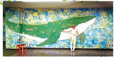
▲暗いイメージだった市原市五井会館の2階が明るく楽しいスペースに！

◀木更津駅東口の高さ4メートルの柱4本を5日間かけて描き上げました。「大工さんのような気分で楽しかったです」とのこと。