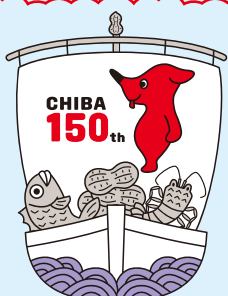
千葉県PRマスコットキャラクター チーバくん

ホールに足を運んで、新しい発見や感動と出会ってみませんか。注目公演をご紹介します