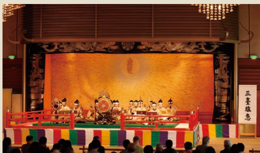
▲「成田山新勝寺 雅楽演奏会」毎年10月第3日曜日に開催。

それぞれルーツは異なるものの、古代に誕生して以来、日本の古き良き歴史と文化を現代に感じさせてくれる伝統音楽を、一度じっくり堪能してはいかがでしょうか。