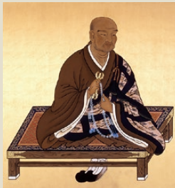
▲寛朝大僧正 不動明王のお告げにより、成田の地に留まり人びとを救うため、成田山新勝寺を開山しました。