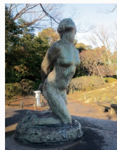
荻原守衛《女》▲日本近代彫刻の最高傑作といわれている

広場や隣接する公園では、戦後日本を代表する彫刻家・柳原義達からカラスをモチーフにしたブロンズ像《道標》や、ロダンの影響を強く受けた荻原守衛の最晩年の作品《女》など、数々の屋外彫刻が目を引きまします。千葉出身の歌人たちの句を刻んだ3つの石碑もあります。