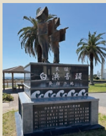
白浜音頭ブロンズ像▶ 白浜で初めて白浜音頭が唄われた旅館「岩目館」跡地に、ブロンズ像が設置されています。

また白浜町では「民謡で町おこし」を合言葉に、平成4年（1992）から白浜音頭全国大会を盛大に開催。平成13年（2001）には大会10周年を記念して、白浜音頭が初披露された旅館・岩目館の跡地（現在の「白浜音頭発祥の地公園」）に白浜音頭ブロンズ像が建立されました。残念ながら大会は平成21年（2009）で終了しましたが、白浜音頭は今も多くの人に親しまれ、各地の盆踊り大会などで唄い踊られています。