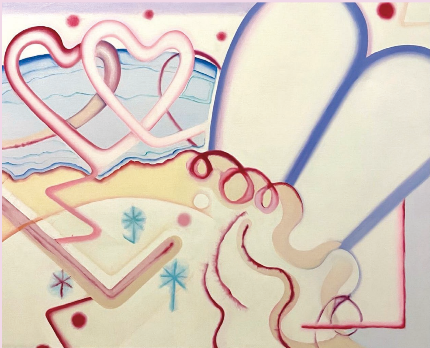
TOMOMI 《By the sea (on my heart)》2023年 油彩 727×919mm