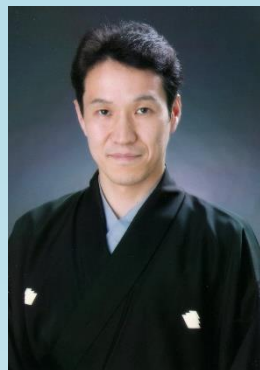
【狂言講座 小笠原匡（和泉流狂言師）】